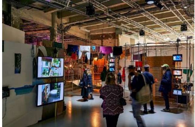
Précédentes créations de Charlie Aubry