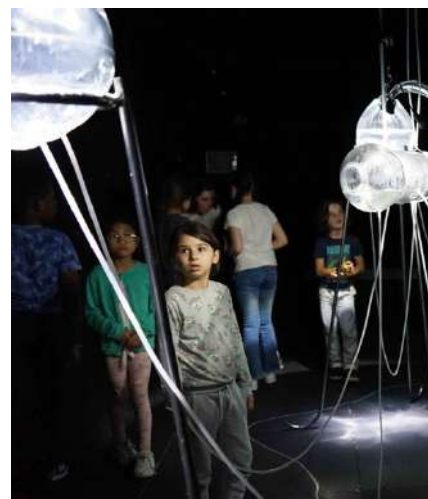
Ateliers et visites de l'installation sonore 2022