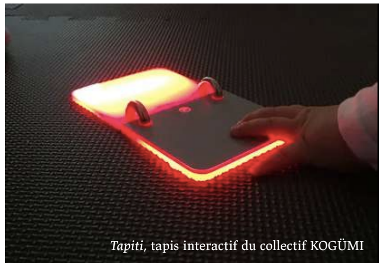
Tapiti , tapis interactif du collectif KOGÜMI