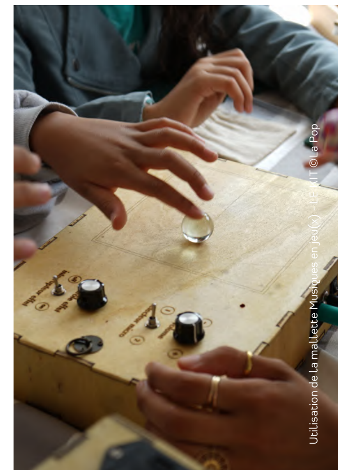
Utilisation de la mallette Musiques en jeu(x) - LE KIT © La Pop

Conçu par l'Office de Diffusion et d'Information Artistique de Normandie avec les musiciens Clément Lebrun et Emmanuel Lalande, Musiques en jeu(x) - LE KIT est une boîte de jeux coopératifs autour de la musique de création. Il contient une trentaine d'activités permettant de jouer avec les sons, de s'amuser à improviser et à enregistrer, d'échanger simplement sans passer par des termes scientifiques, et de découvrir différentes compositions musicales. Les médiatrices de La Pop se sont formées à l'utilisation de cette mallette pédagogique à l'occasion d'une formation organisée par l'Office de Diffusion et d'Information Artistique de Normandie avec le musicien Clément Lebrun le 19 mars 2026. Les jeux choisis pour accompagner la visite du Mythe Les fèves d'argent se concentreront sur l'exploration de la voix et des sensations corporelles produites par les sons.