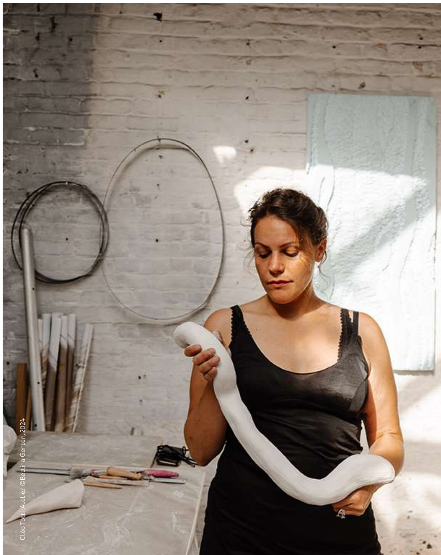
Cléo Totti-Atelier

Je souhaite que ce soit comme aller dans un paysage pour méditer. Mais ce n'est pas méditer dans le sens « zen », c'est méditer sur ce qu'on voit. C'est plutôt inviter à la contemplation, à regarder, à voir le détail, à observer. En regardant les plantes qui sont en velours, tu peux voir tous les reflets de lumière. C'est ce genre de détail qu'on ne regarde pas d'habitude auquel j'ai envie de nous rendre attentif·ve·s. Il y a tellement de profusion autour de nous qu'il faut réapprendre à observer, contempler. C'est comme avec les tissus, il y a beaucoup de plis, et avec la lumière, on voit tous les interstices, c'est ce qui m'intéresse. C'est tous ces petits entrelacs. J'ai juste envie de montrer que tout cela est magnifique. Cette fragilité et tous ces détails inspirent les artistes depuis la nuit des temps !