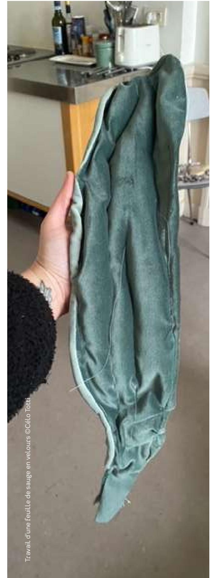
Travail d'une feuille de sauge en velours ©Cléo Totti

Les fèves en céramiques représentent cette culture de la terre qui nous permet de nous nourrir. Symbole de vie, les fèves sont cultivées depuis l'Antiquité, notamment dans les terres arides et sèches. Le lien entre l'art et la terre se fait à travers les matériaux qui ont été utilisés pour créer les sculptures de l'installation : l'argile, le cuivre, la céramique, ils proviennent tous de la terre. Cléo Totti replace la terre au centre, c'est elle qui est à l'origine de toutes choses, elle est la terre nourricière. Dans cette installation, la terre comme matériaux ou allégorie est au cœur du fond et de la forme.