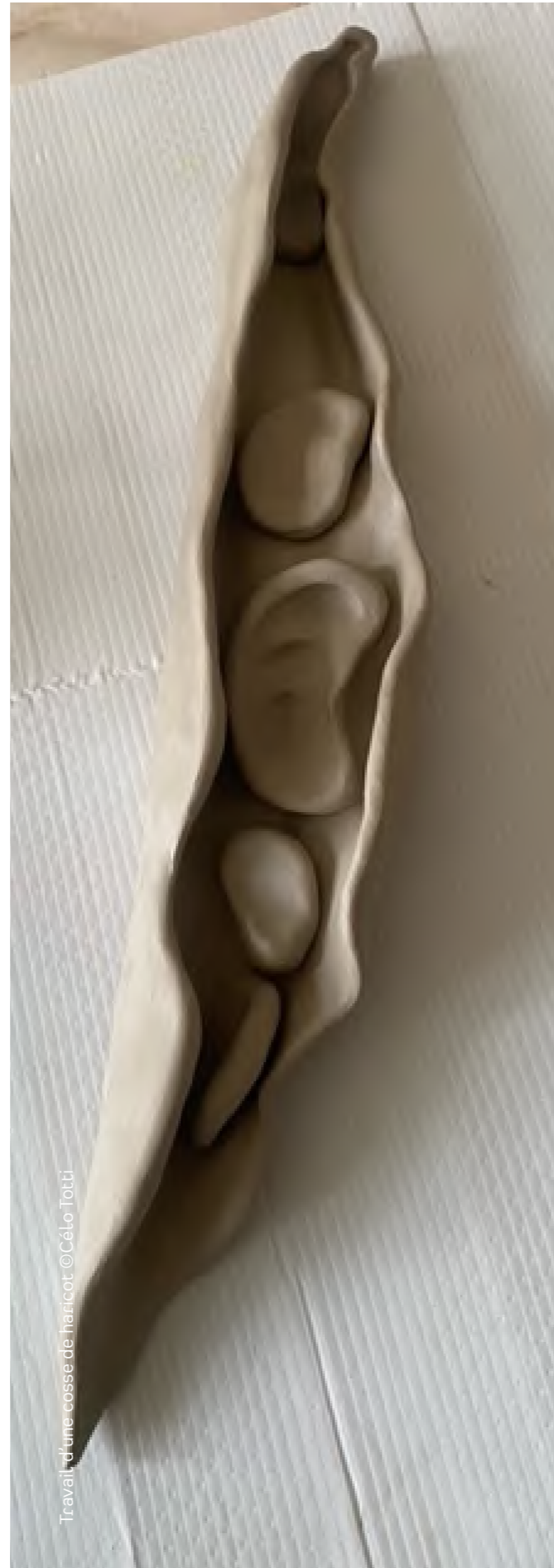
Travail d'une cosse de haricot ©Cléo Totti

Les sculptures sont directement inspirées par la nature, dont l'observation nourrit les artistes depuis la nuit des temps. Les premières représentations artistiques étaient des scènes quotidiennes dans la nature (cueillettes, chasses etc.). Avec cette œuvre, l'artiste souhaite créer un temps suspendu où les spectateur·ice·s peuvent prendre le temps d'observer cette nature, de la ressentir, l'entendre respirer, d'appréhender les matières, formes et sons et de pouvoir prendre plaisir à observer les détails du vivant.